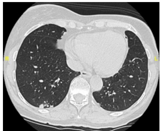
Figura 1. TC de tórax, donde se evidencia la presencia de nódulos pulmonares derechos de reciente aparición.

teraciones. Broncoscopia + toracoscopia con toma de biopsia de segmento inferior y ganglio, reporta histiocitos espumosos PAS positivos-diatasa resistentes, técnicas de histoquímica demostraron presencia de bacterias de tipo bacilar, negativas para ZN compatible con Tropheryma Whipplei .